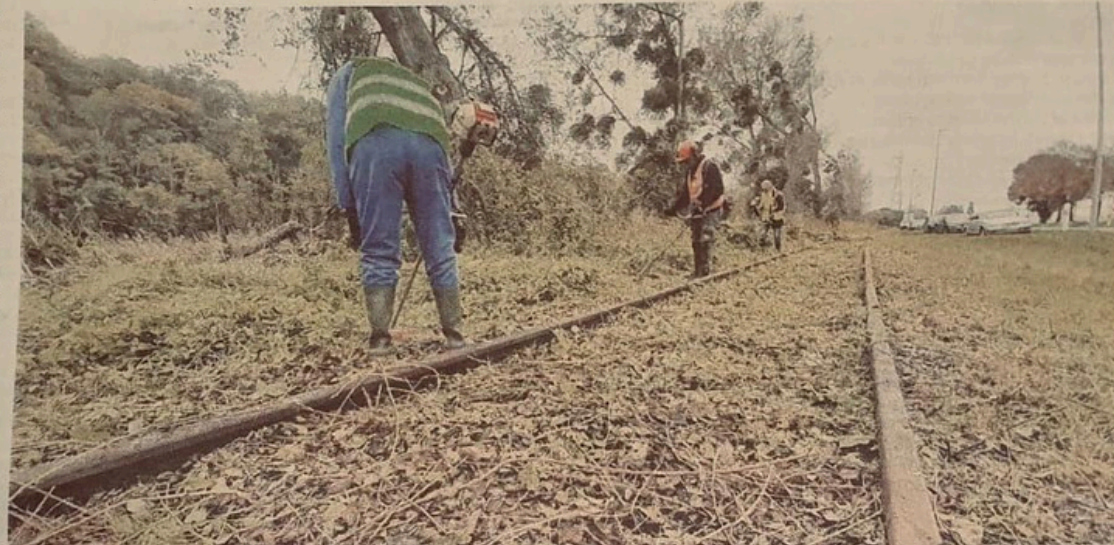
L'entretien d'espaces verts réalisé par des Entreprises sociales apprenantes (ESA) fait partie des activités les plus connues du grand public.

Le réseau CHANTIER école estime que 20 000 équivalents temps plein, soit 60 000 personnes bénéficiant d'un parcours d'insertion, sont menacés en France. « On parle d'une perte de budget d'environ 15 % et ces chiffres n'ont pas été contestés, précise David Horiot, président du réseau national. On est déjà dans une situation dans laquelle on rationalise au maximum alors qu'on mène une mission qui est quasiment d'intérêt général. Je ne connais personne qui n'ait jamais rencontré, dans sa vie, une personne en difficulté qui avait besoin d'être accompagnée. De mémoire, on permet en